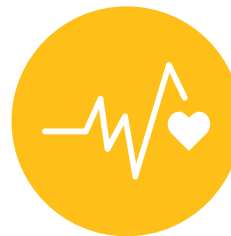
WELLBEING, ZDRAVLJE I WELLNESS