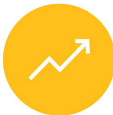
DEŠTINACIJSKI MENADŽMENT - OSNOVE I TRENDVI