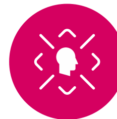
NOVE CILJNE SKUPINE ZA TURISTIČKO GOSPODARSTVO