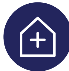
UGOSTITELJSTVO - OSNOVE I PRAKSE PRIMJENE