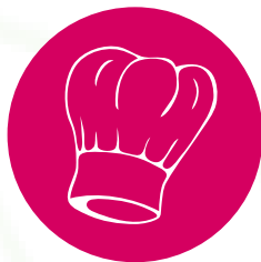
TRENDVI U KULINARSTVU