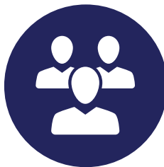
LJUDSKI POTENCIJALI U TURIZMU