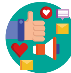
DIGITALNI MARKETING I PRODAJA U TURIZMU